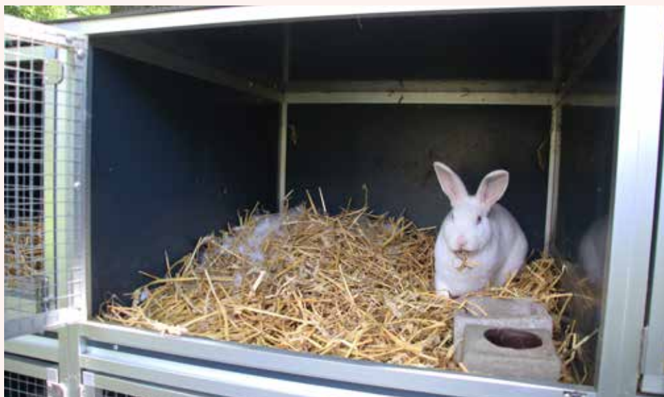
Een nestje witte Rexen (nog niet zichtbaar) vol beloftes