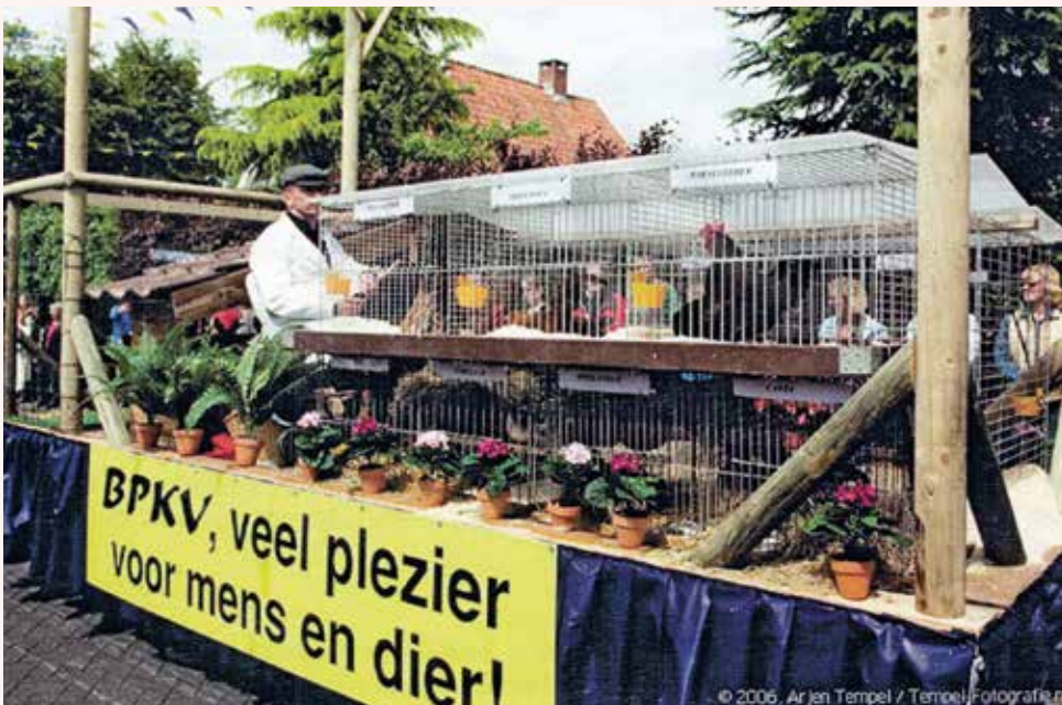
Optochtswagen.